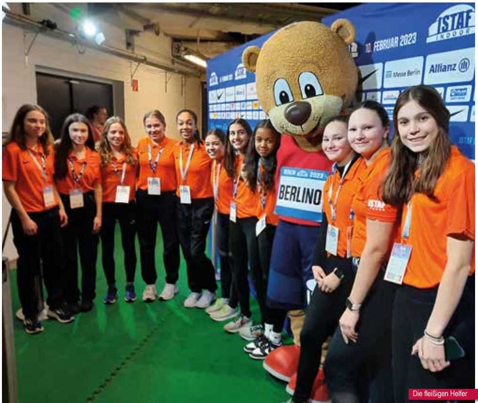
Die fleißigen Helfer

Nicht vergessen: Das nächste ISTAF im Olympiastadion am Sonntag, dem 3. September 2023! ■