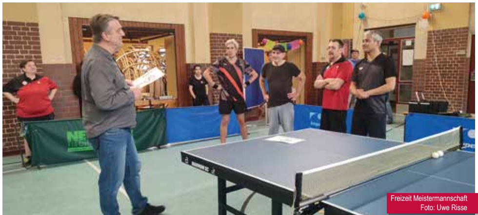
Freizeit Meistermannschaft