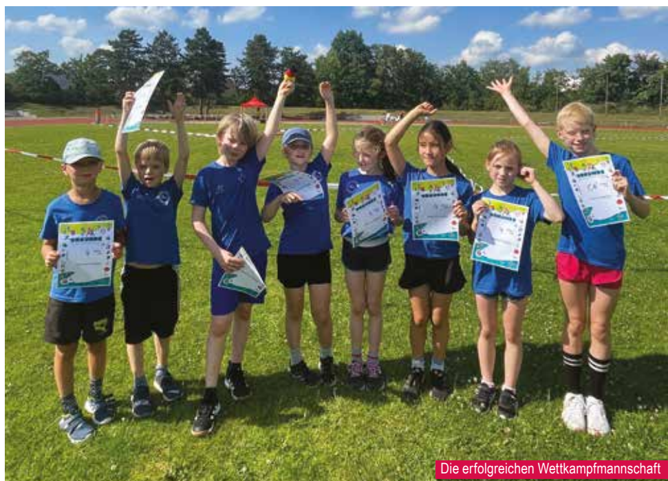
Die erfolgreichen Wettkampfmannschaft

Das Trainerteam ist sehr stolz auf die Leistungen der Kids und freut sich auf die noch kommenden Wettkämpfe! ■