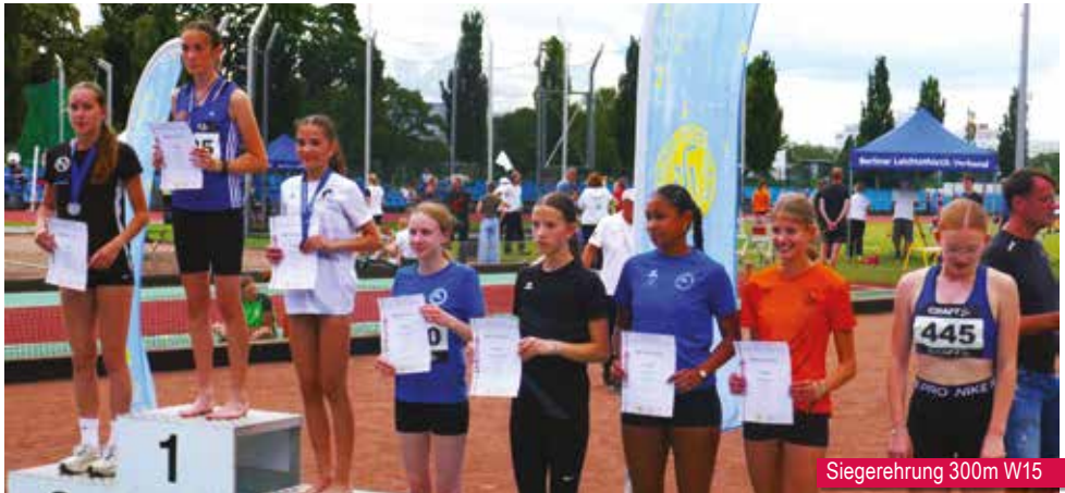
Siegerehrung 300m W15