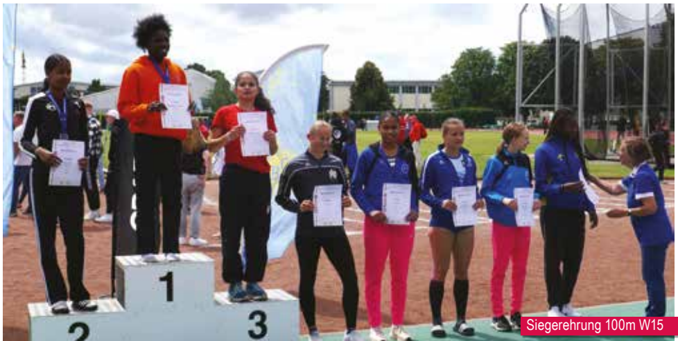
Siegerehrung 100m W15