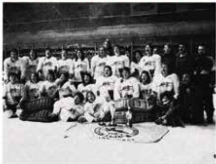
Deutscher Meister in Weißwasser, 16. - 17. Februar 1991 OSC - Eishockeydamen