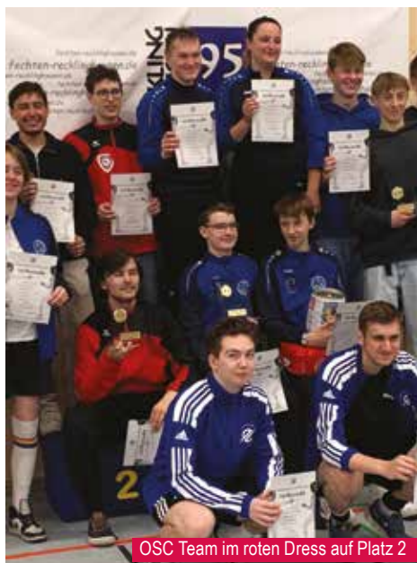
OSC Team im roten Dress auf Platz 2

So hat sich die Reise in die Kulturmropole für das junge OSC Degen Team mehr als gelohnt. ■