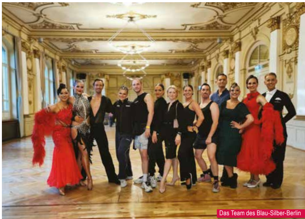
Das Team des Blau-Silber-Berlin

Vom 4. bis 6. Juli ging es für zahlreiche Blau-Silber-Paare zur danceComp in die Historische Stadthalle in Wuppertal. Über drei Tage starteten sie in unterschiedlichen Klassen und WDSF-Turnieren, teils mit internationaler Konkurrenz in einer der schönsten Tanzlocations, die der Turniersport zu bieten hat.