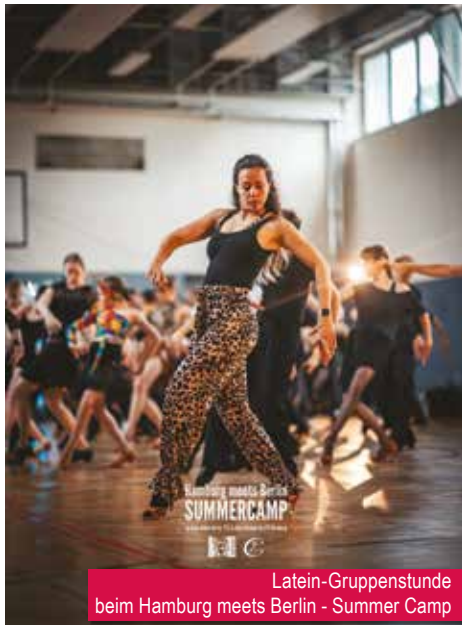
Latein-Gruppenstunde beim Hamburg meets Berlin - Summer Camp

Vom 11. bis 13. Juli trafen sich knapp 100 Tänzerinnen und Tänzer aus Blau-Silber Berlin und dem Club Céronne Hamburg – verstärkt durch begeisterte Paare darüber hinaus – zur zweiten Edition unseres Summer Camps in der Sportschule Zinnowitz.