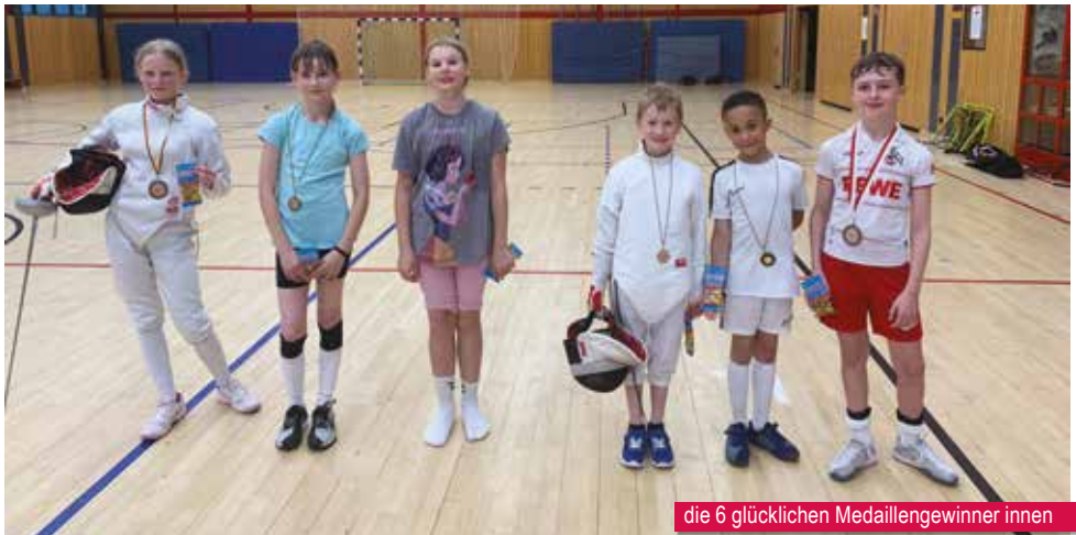
die 6 glücklichen Medaillengewinner innen