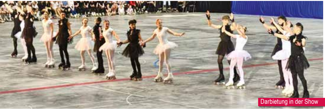
Darbietung in der Show