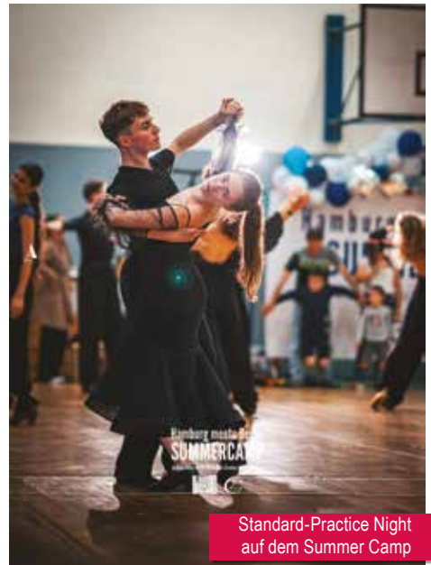
Standard-Practice Night auf dem Summer Camp