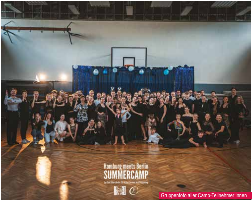
Gruppenfoto aller Camp-Teilnehmer:innen

Das Fazit: drei Tage voller sportlicher Höchstleistung, Teamgeist und Sommerfeeling pur. Wir freuen uns schon auf das nächste Camp! ■