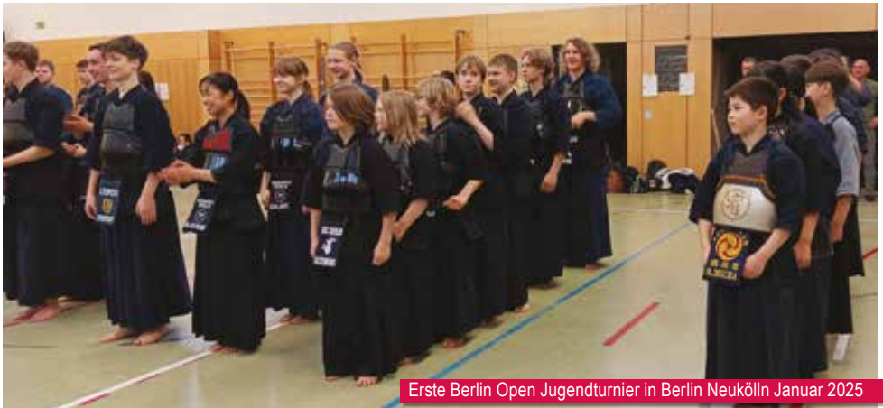
Erste Berlin Open Jugendturnier in Berlin Neukölln Januar 2025