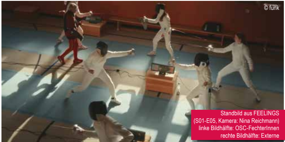
Standbild aus FEELINGS (S01-E05, Kamera: Nina Reichmann) linke Bildhälfte: OSC-FechterInnen rechte Bildhälfte: Externe